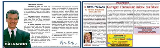
esempio di newsletter veicolata da PROPOSTA