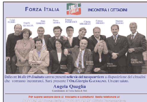
esempio di cartolina: 35.000 copie, in tutti i quartieri di Asti ( vedi originali)